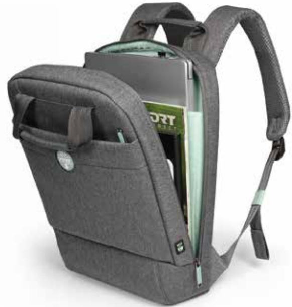
13/14" padded notebook compartment and front zipper pocket Compartment rembourré pour ordinateur portable 13/14" & poche zippée frontale