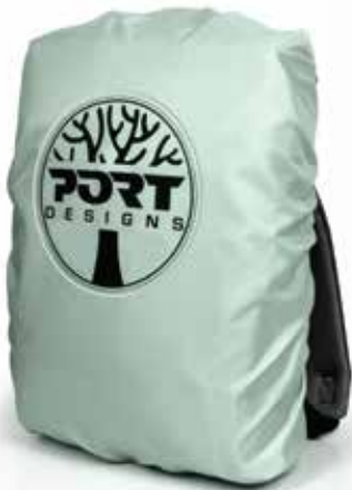
Housse de pluie incluse avec bande réfléchissante Included rain cover with light reflective band