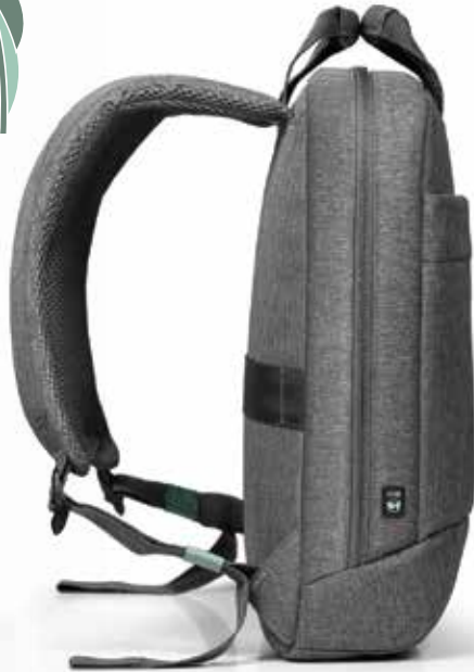
Comfortable & padded shoulder straps Bretelles confortables et rembourrées