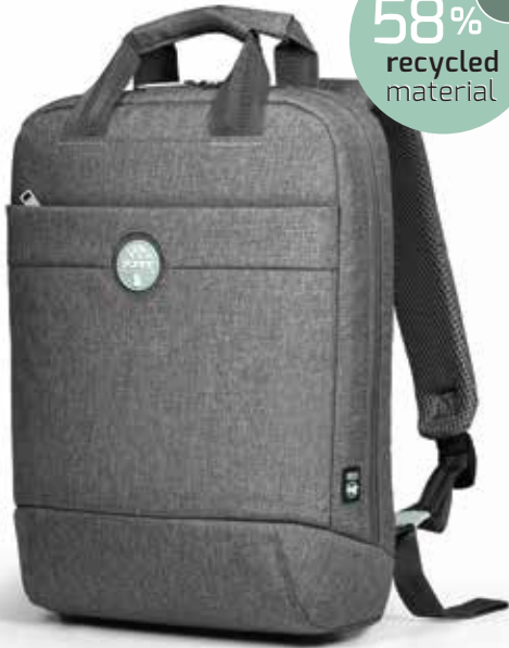
Compact & lightweight backpack Sac à dos compact & léger